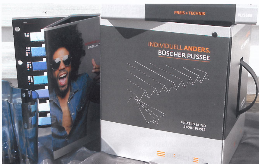
Die ganze Welt der Farben in einem stylishen Ordner mit 13 Kollektionskarten – maximale Gestaltungsvielfalt für jeden Geschmack.

Heinrich BÜSCHER GmbH – Sonnenschutzsysteme – Tel. 0551 - 69 32 37 www.buescher-sonnenschutz.de