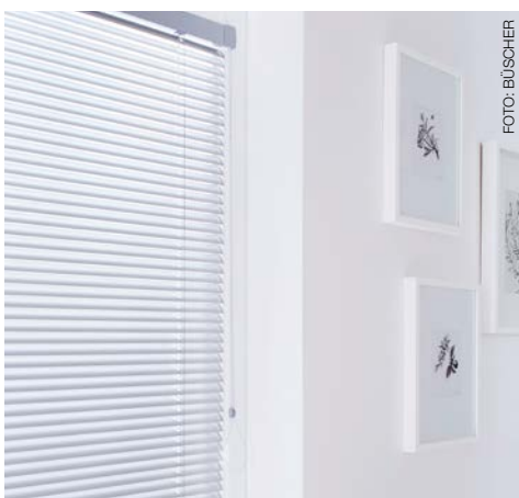
Hersteller Büscher hat eine Neuauflage der kompakten Kollektion piccolo herausgebracht.