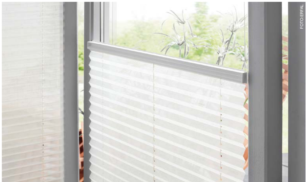
Bei erfall in Falkenstein ist in den zurückliegenden Wochen intensiv an der Fertigstellung der Verkaufsunterlagen zum neuen Smart-Plissee gearbeitet worden; die Variante für den Dachfensterbereich folgt bald.