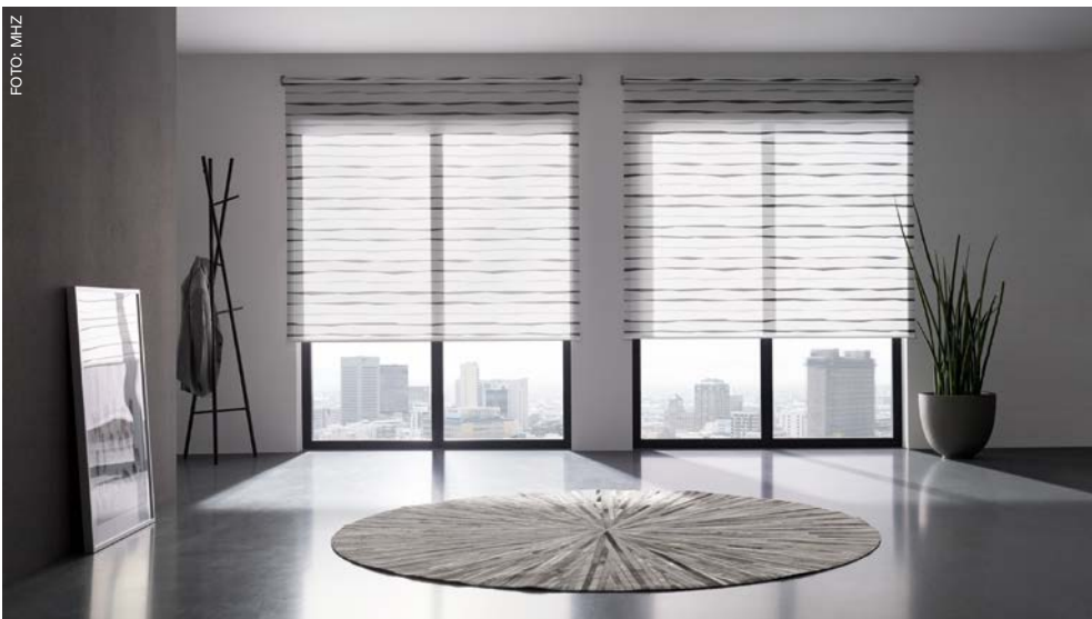
Bei der Montage akkubetriebener Sonnenschutzsysteme – hier von MHZ – entfallen Installationsarbeiten für Strom- und Steuerleitungen. Der Putz wird nicht beschädigt und es wird kein Schmutz verursacht.

Im Herbst blicken wir auf das erste Halbjahr 2017 und kommende Messen