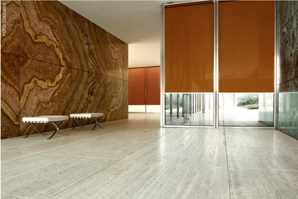
Coulisse konnte Wachstum auf breiter Ebene erzielen, also sowohl in den wichtigen europäischen als auch in den außereuropäischen Ländern, erklärt das Unternehmen, das auch 2018 wieder auf der R+T ausstellt.