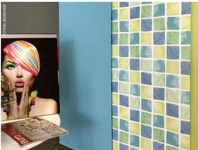
Die neue Büscher-Kollektion bietet eine spezielle Auswahl an individuellen Eigendessins im Mix mit Klassikern und Drucken in Trendfarben.

Flächenvorhangtechnik zeigt eine Schiene in filigraner Optik in Verbindung mit zweigeteiltem Paneelwagen. Das Gleitprofil verschwindet teilweise in der Schiene, so dass kein störender Lichtspalt zwischen Schiene und Paneelwagen entsteht. Attraktive Bemusterungspakete als Rollo oder Flächenvorhang unterstützen den Fachhandel bei der Präsentation der neuen Kollektion. „Selbstverständlich ist die neue Auswahl bereits digital in die Bestell- und Beratungsplattform eingebunden, damit der Fachhandel sowohl bei der Beratung als auch beim Bestellvorgang bestens und modern aufgestellt ist“, erklärt der Anbieter von Sonnenschutzsystemen. Gerade erst vorgestellt, ist die nächste Ergänzung für die Kollektion Special Selection übrigens schon in Arbeit.