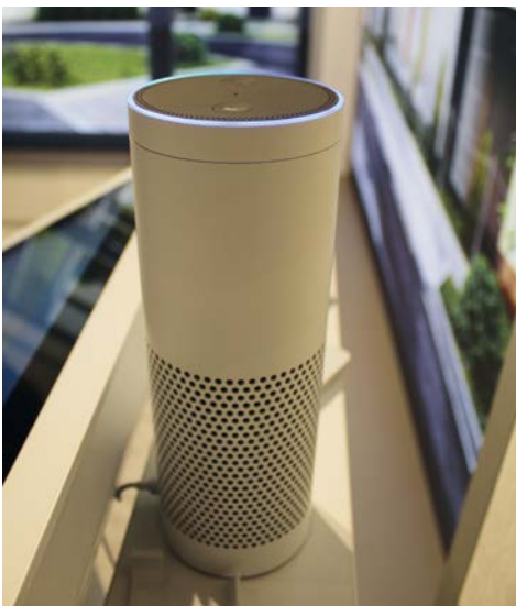
Sonnenschutz per Sprachsteuerung bedienen? Das geht schon heute, wie etwa erfal zeigte.