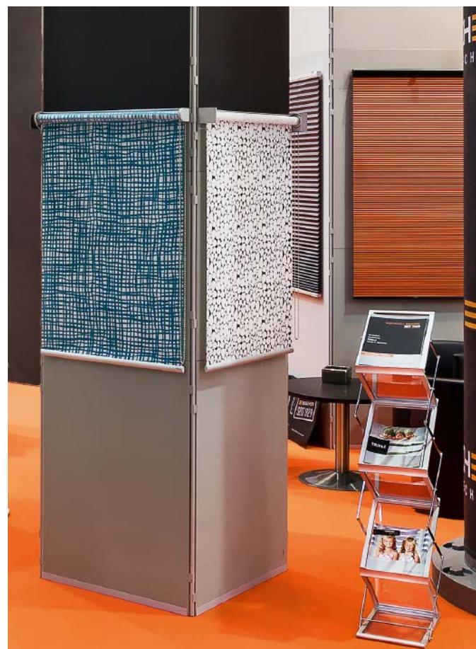
Attraktive Bemusterungspakete als Rollo oder aber Flächenvorhang unterstützen den Fachhandel bei der Präsentation der neuen Kollektion.

Leichte transparente Unistoffe – insbesondere für Flächenvorhänge geeignet – ergänzen das Sortiment im Bereich „Uni“. Auf gleicher Grundware bieten die neuen floralen und grafischen Eigendessins im Druckbereich in der Rubrik „happy colors“ attraktive Kombinationsmöglichkeiten mit der Unipalette. Zudem bereichern zwei neue florale Prints das Sortiment bei den Blackout-Stoffen.